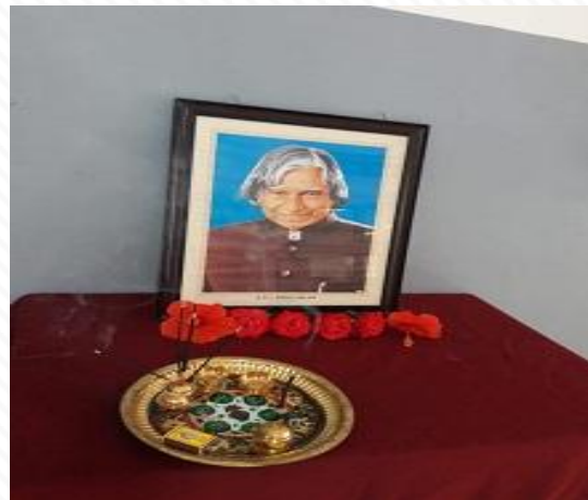
APJ Abdul Kalam Jayanti