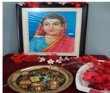
Savitribai Phule Jayanti