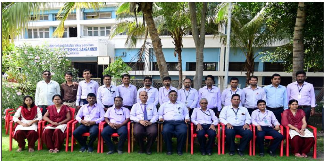
Faculty of E& TC Department