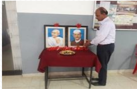
Gandhiji jayanti and Lal Bahadur Shastri Jayanti